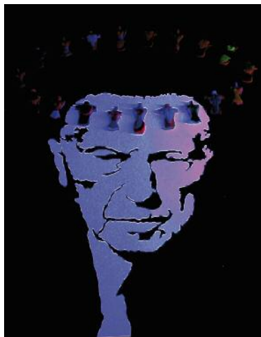
HEILIGE & SCHEINHEILIGE (Ausschnitt), 2010